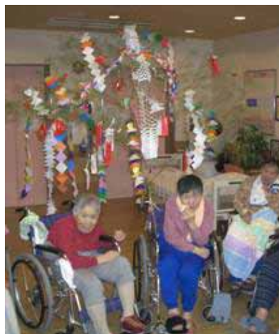
出来上がった七夕飾りの前で記念撮影